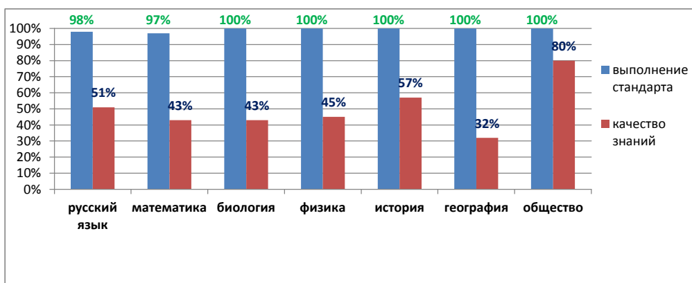
Рис. 1. Распределение отметок за ВПР в % от числа участников

Как видим из таблицы и диаграммы, самые высокие результаты обучающиеся продемонстрировали по обществознанию (качество знаний – 80%), самые низкие – по географии – 32%.